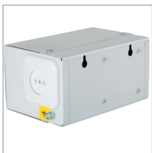
Каплевидные отверстия для монтажа к стене.