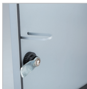
Петли для осуществления блокировки дверки от открытия при включенном выключателе-разъединителе.