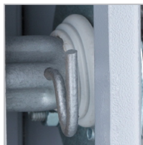
Уплотнение оси привода выключателя-разъединителя для обеспечения степени защиты IP54.